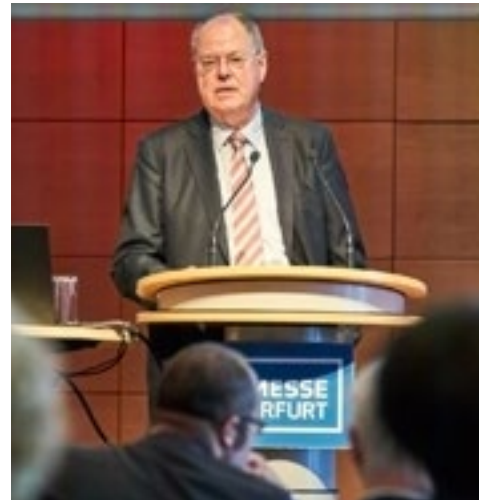
EAST: Keynote-Speaker Peer Steinbrück

Die erste EAST Energy And Storage Technologies – der Fachkongress für innovative Speicherkonzepte mit begleitender Ausstellung – war ein voller Erfolg! Auf dem