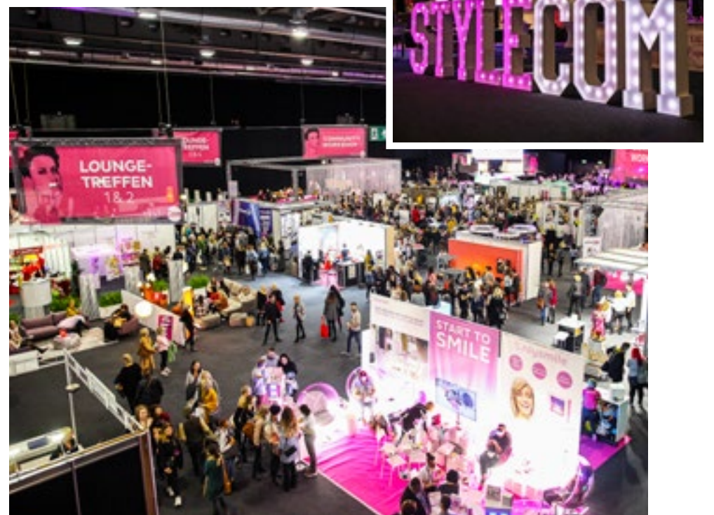
Blick ins pinkes Paradies auf der StyleCom