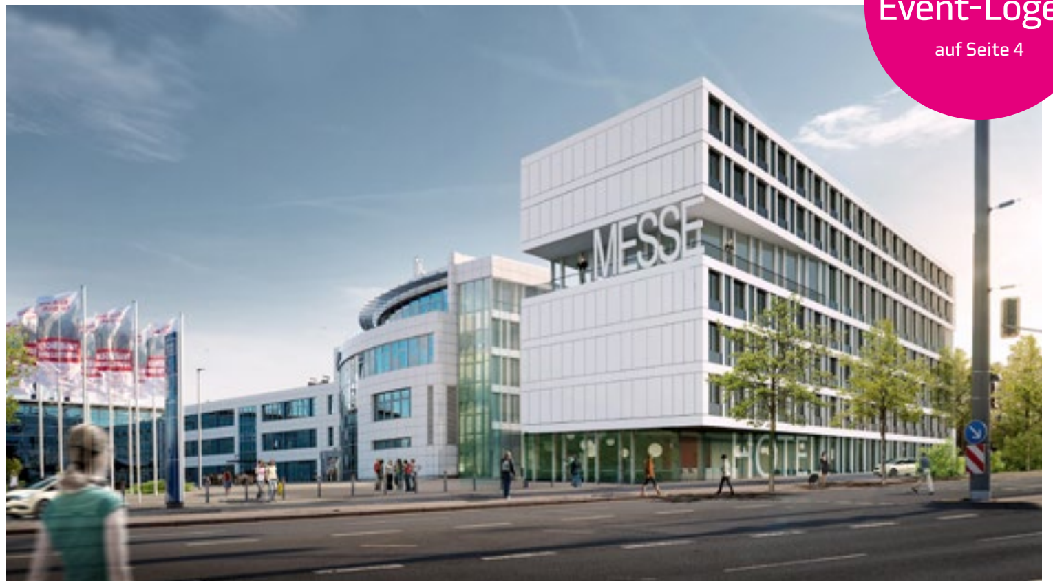
Visualisierung des Messehotels durch die Fibona GmbH (Investor und Betreiber)

Das VIP-Erlebnis: Event-Logen auf Seite 4