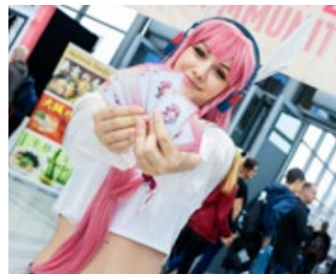
MAG 2019: Kreativer Cosplay-Fan