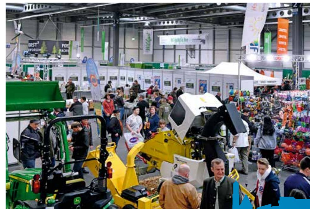
In drei Messehallen sowie im Freigelände präsentierten Aussteller, Verbände und Vereine ihre Arbeit, Produkte und Dienstleistungen.

Die Fachhochschule Erfurt lud zu Präsentationen zur Wertschöpfungskette Wald-Holz ein. Auch zahlreiche Fachforen fanden großen Anklang bei den Besucherinnen und Besuchern. Themen wie der Einsatz von Drohnen in der Forstwirtschaft sowie die richtige Schutzausrüstung zogen das Publikum an. Weitere Vorträge widmeten sich topaktuellen Themen wie dem Borkenkäfer oder Waldumbauprojekten. Mitmachaktionen zu Natur- und Artenschutz begeisterten Familien. Bei Waldquiz, dem Waldfilm in 100 Sekunden, der Jagdhundpräsentation oder dem Probieren von leckeren regionalen Wildrezepten kamen alle auf ihre Kosten. Insgesamt profitierten viele Gäste von der neuen Symbiose der beiden Messen Reiten-Jagen-Fischen und FORST 3 . Beide Themenfelder ergänzen sich und bieten dem interessierten Publikum eine facettenreiche Angebotsvielfalt. /