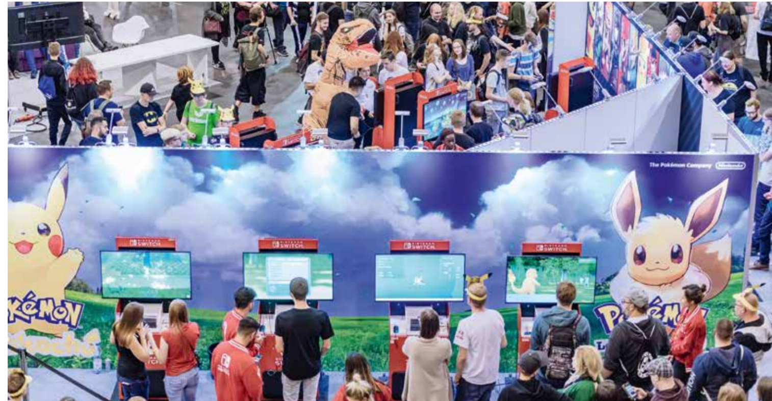
Fast 10.000 Gäste konnte die MAG bei ihrer letztjährigen Premiere zählen. In 2019 möchte die Messe Erfurt an diesen Erfolg anknüpfen.

Die Messe Erfurt zeichnet ein abwechslungsreicher und stimmiger Veranstaltungskalender aus. Dabei setzen die Planer und Partner aus Erfurt nicht nur auf altbekannte und immer wiederkehrende Messeformate, sondern entwickeln, abhängig von der aktuellen Nachfrage, neue Konzepte für Messen.