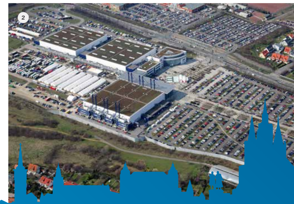
1. In der Multifunktionshalle der Messe Erfurt finden die größten Indoor-Veranstaltungen im Freistaat Thüringen statt. 2. Das Messegelände soll auch verkehrstechnisch optimiert und erneuert werden. 3. In der Messehalle 2 ist der Einbau von variablen Trennwänden zur räumlichen Abtrennung für Tagungen und Kongresse geplant. 4. Wolfgang Tiefensee setzt sich für die Messe Erfurt GmbH ein.