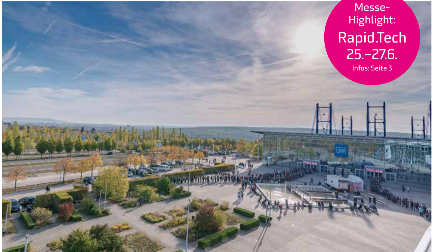
Das Land Thüringen investiert 28 Millionen Euro in das Erfurter Messegelände.

Messe- Highlight: Rapid.Tech 25.-27.6. Infos: Seite 3