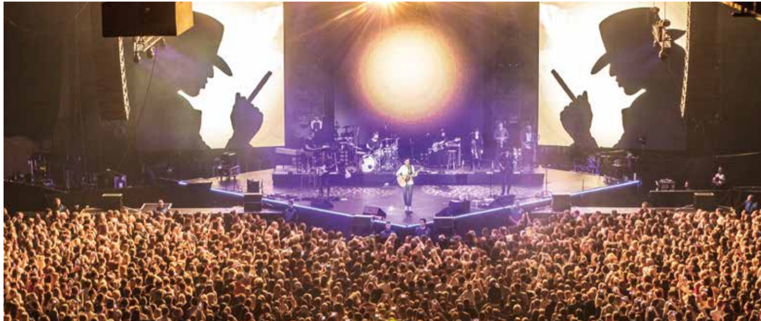
Der Lokalmatador CLUESO spielt seit einigen Jahren an zwei Folgetagen vor ausverkauftem Haus in Erfurt.

Konzerte in der Messe Erfurt sind häufig ausverkauft. Das spricht für die Größen aus aller Welt, die auf dem Messegelände auftreten, – aber auch für die Messe Erfurt, die hervorragend für große Konzerte geeignet ist.